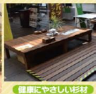
健康にやさしい杉材