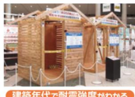
建築年代で耐震強度がわかる