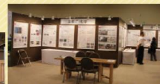
大学による様々な木材/木造建築の研究に関する紹介