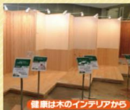
健康は木のインテリアから