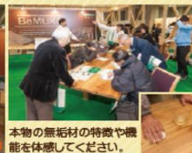
本物の無垢材の特徴や機能を体感してください。