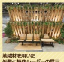
地域材を用いた外壁と特殊ルーバーの展示