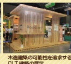
木造建築の可能性を追求するCLT建築の展示