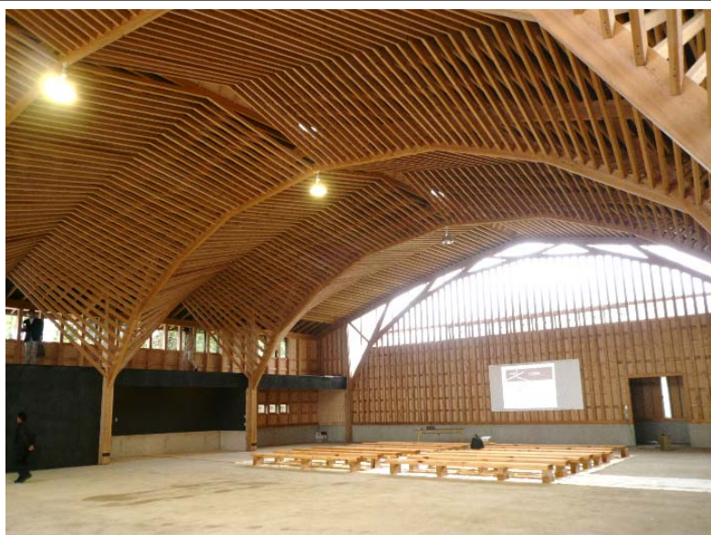
北沢建築 本社工場棟